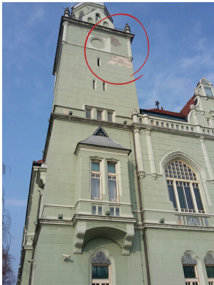
Gradska kuća, Apatin